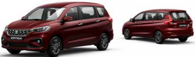
أحمر ميتاليك Auburn Red Pearl Metallic (ZYY)