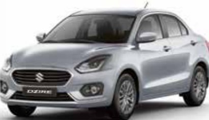
ميتالك فضي (Z2S) Silver Metallic