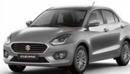
ميتالك رمادي (Z7Q) Magma Gray