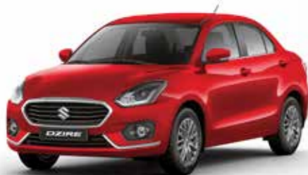
ميتالك أحمر (ZYC) Red Metallic