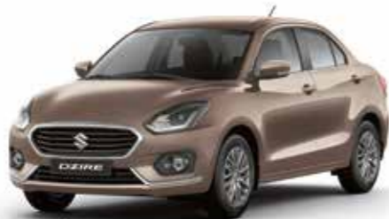
ميتالك بني (ZYB) Brown Metallic