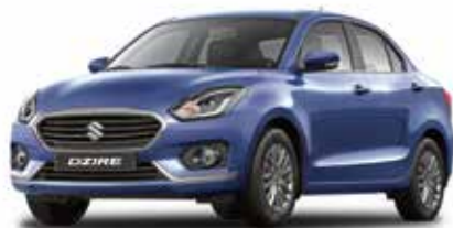
ميتالك أزرق (ZYA) Oxford Blue